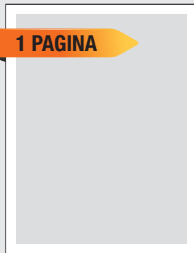
1 página: 23 cm ancho x 30 cm altura

Los planos deben ser vectoriales y no mapa de bits para poder ampliarlos o reducirlos sin pérdida de calidad. Para ello puede ser en formato AI o EPS de Adobe Illustrator o PDF generado desde AutoCad.