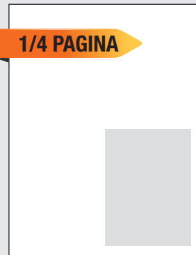
1/4 página: 10 cm ancho x 13,5 cm altura